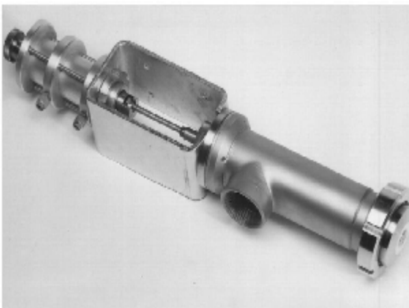
1 – Sitz - Dosierventil

Dieses Ventil eignet sich speziell für Körnige Produkte wie z.B. Wandverputze.